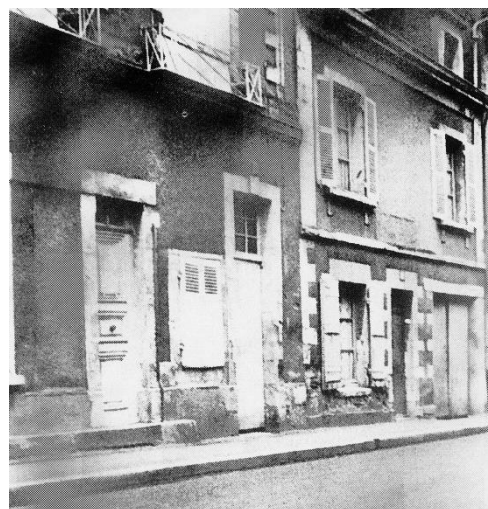
La rue Saint-Jacques à Angers